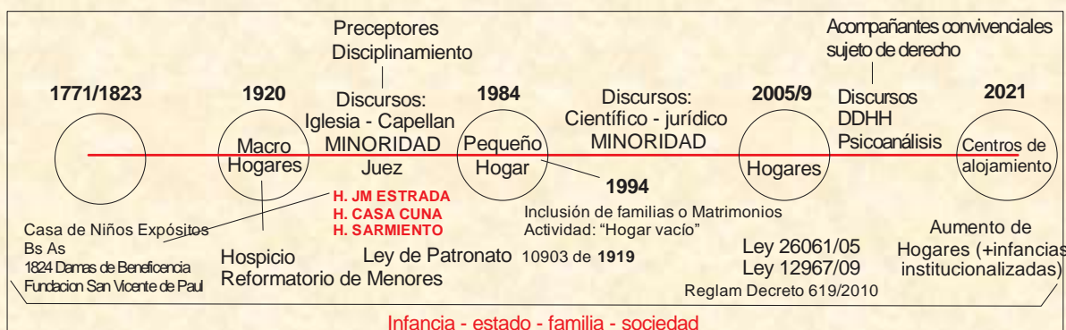
GRAFICO 1: Línea del Tiempo: Infancia institucionalizada

A partir del relato de los informantes es posible dibujar una línea histórica lo cual permite ver la transición de un paradigma tutelar al paradigma de derechos de la infancia institucionalizada.